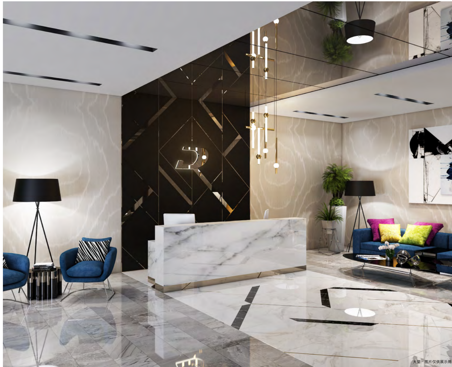
大堂 - 图片仅供展示用