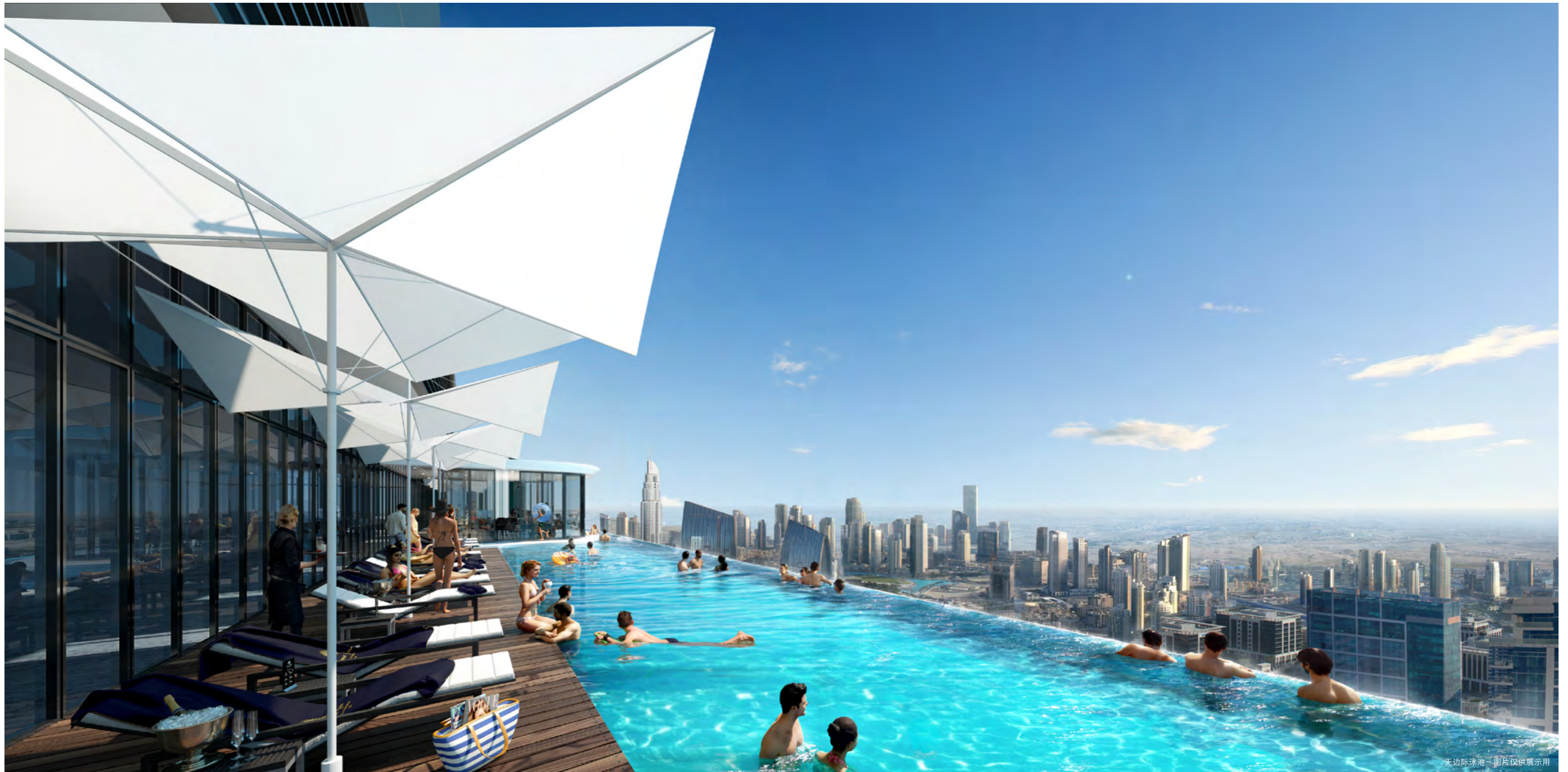
无边际泳池 - 图片仅供展示用