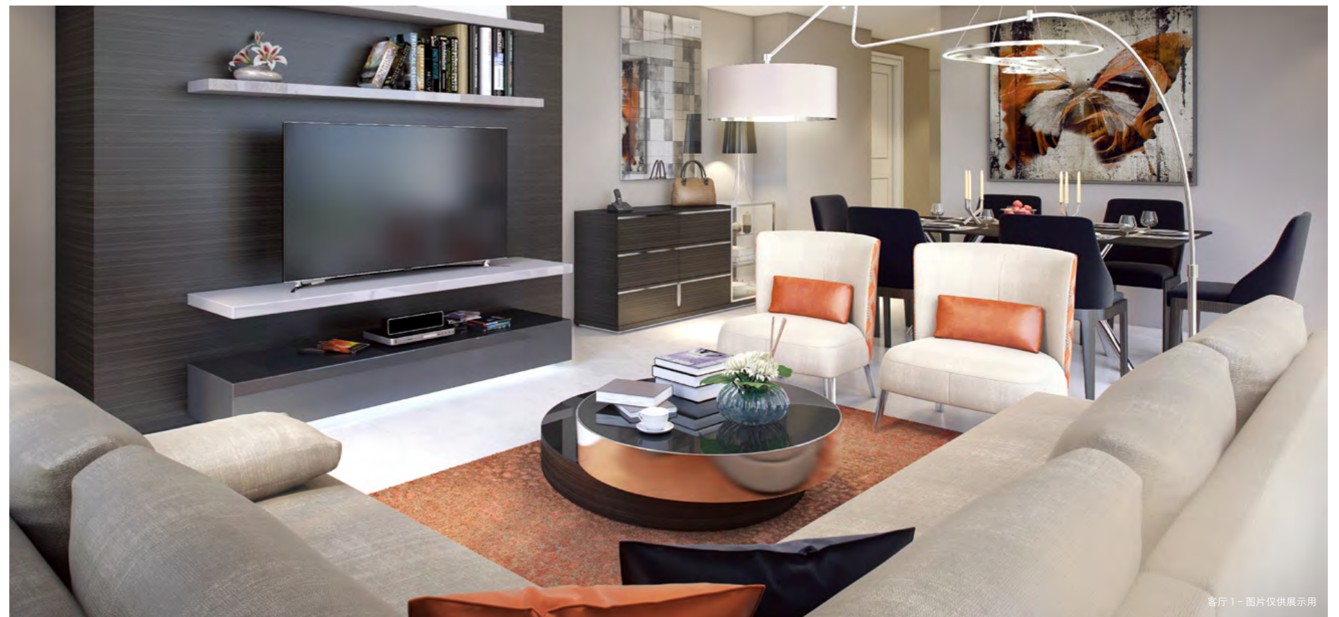
客厅 1 - 图片仅供展示用