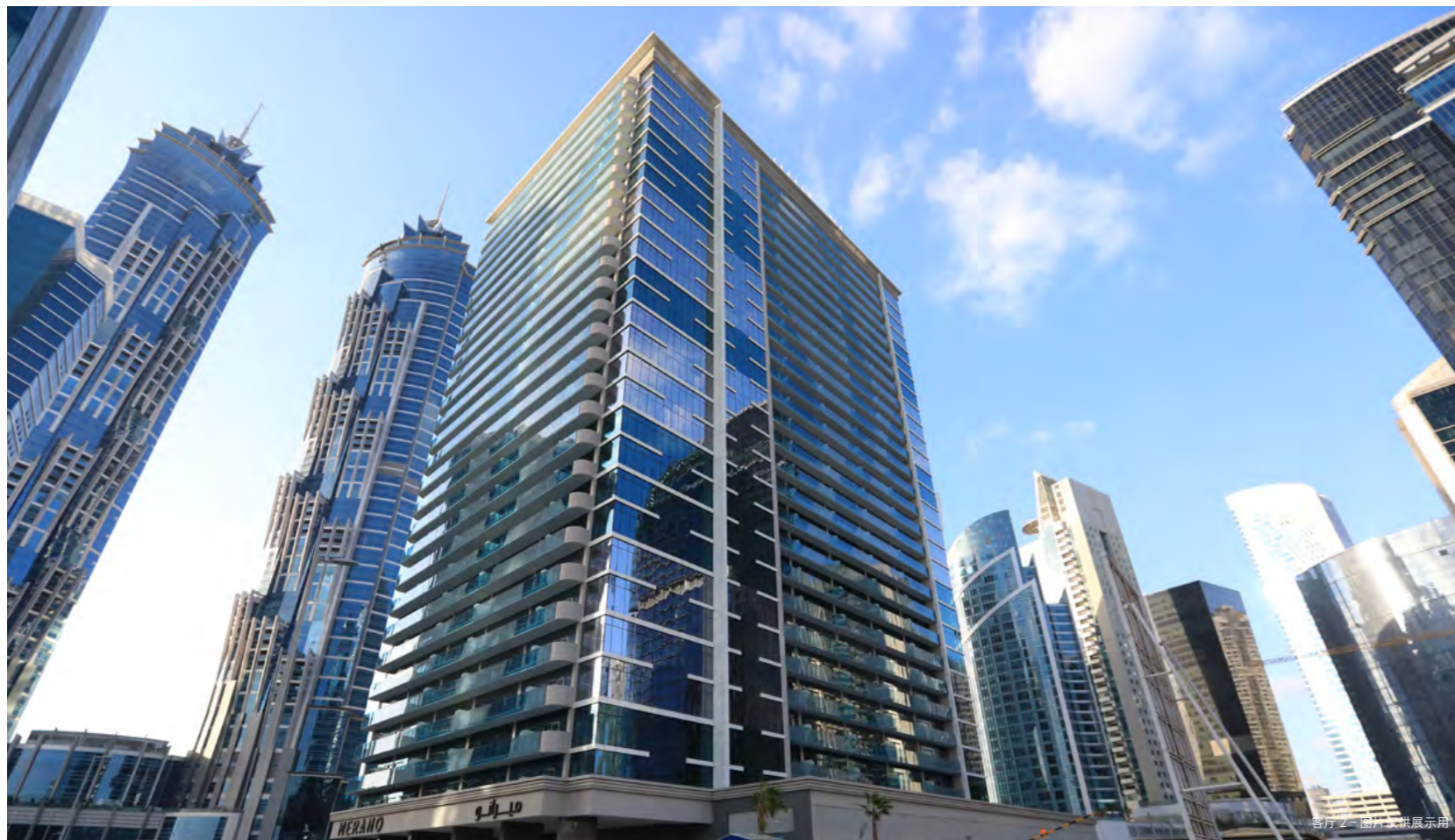
客厅 2 - 图片仅供展示用