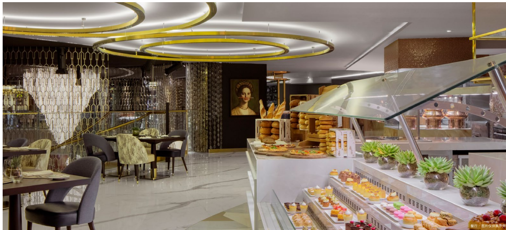
餐厅 - 图片仅供展示用