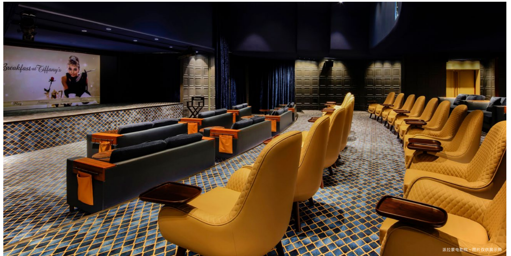
派拉蒙电影院 - 图片仅供展示用